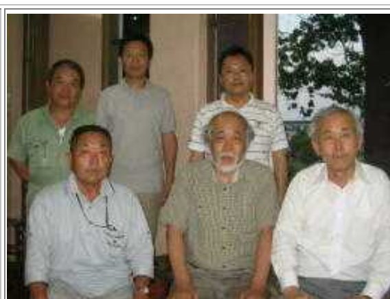
交流宮代への報告・協力依頼説明会

同日、交流宮代3役へ教育委員会への報告と同様な本事業の説明をおこない、今後の自立活動については、ぜひ地元商店主、事業主の協力をお願いしたいと力説した。交流宮代の方々より、本活動に対する理解が示され、前向きな意見が数々だされ。交流会内部で検討することとした。地元の商店主、事業主は、自然・環境保護/修復/改善、地元名産のPR、大学通りイルミネーションイベント等の環境のみならず地域の発展、安全等の幅広い活動検討を進めており、総合的な連携をした提案がポイントであろう。上写真右