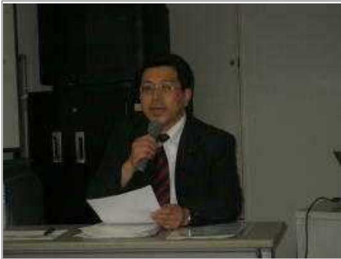
千葉県県議会議員 遠藤英喜氏