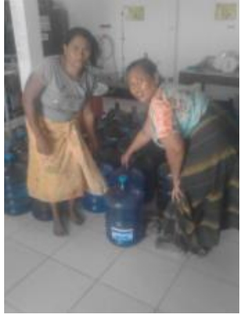
飲料水の地元民への提供

ジャワ本島タンギスジャワのコーヒ農園では、コーヒ豆加工工場の建設が開始されました。コーヒ豆の木も植え付けられ順調に育っています。