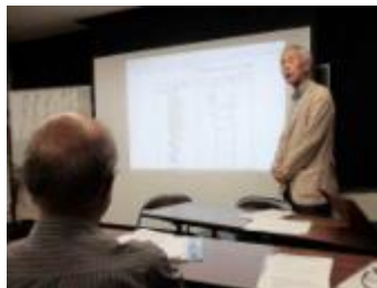
尾園代表理事 挨拶:活動報告