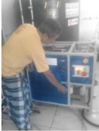
フル稼働の浄水器