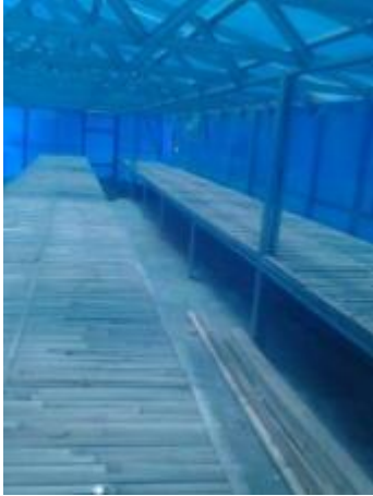
リニューアルされた海藻乾燥台

ロンボク島セリウエ漁村の海藻加工工場では採れた海藻を乾燥させる台を、網から竹敷板に変更し生産性・品質を向上させるようにしました。また工場で太陽光・風力を電源とした浄水器で製造される飲料水が地元民に提供出来るようになりました。工場は着々と地域に根差したものとなってきました。