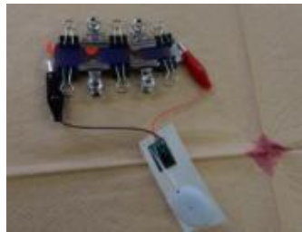
セルを3つ繋いでオルゴール取付