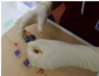
電解液(イソジン)を加え電極取付