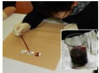
ハイビスカス色素の滴下