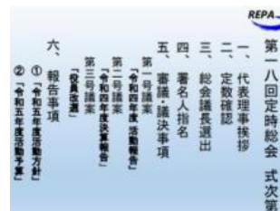
式次第 (クリックで拡大)

その後引き続き、第2回理事会が開催され、第1号議案:代表理事再任の件、第2号議案:会長