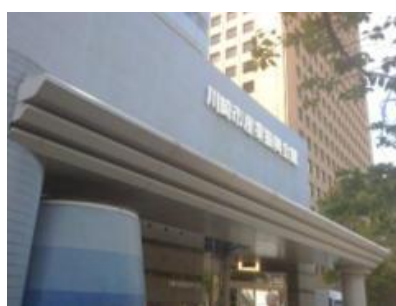
会場となった川崎市産業振興開館

質疑応答では、風力発電に関連した事項だけでなく、将来の地球温暖化の問題、参加者（熟年者多数）が出来ることは何か等、幅広い質疑、意見交換がなされました。意見交換は時間が足りず、引き続き開催された懇親会の席でも有意義に行われました。